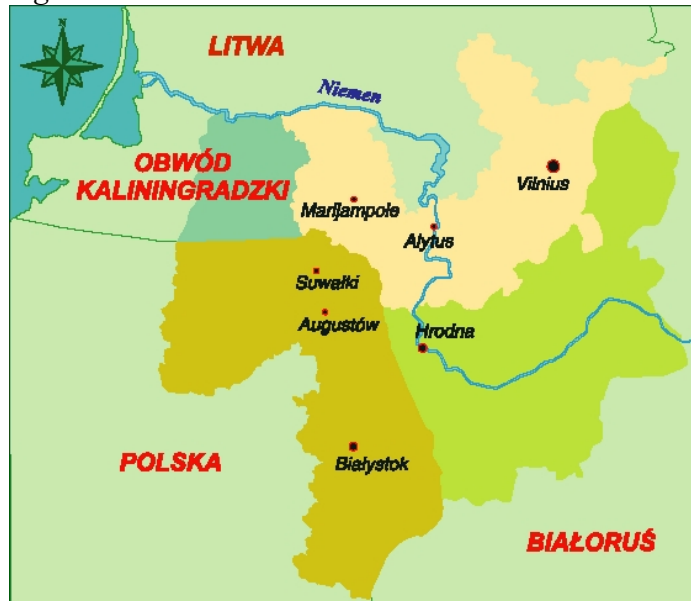
Rysunek 1 Mapa Euroregionu Niemen

Związek Transgraniczny Euroregion Niemen został utworzony na mocy trójstronnego porozumienia (polsko - białorusko - litewskiego) 1 podpisanego 6 czerwca 1997r. w Augustowie. Utworzeniu Euroregionu Niemen przyświecał szczytny cel integracji społeczności przygranicznej, rozwoju demokracji lokalnej, a także nadrobienia zaległości gospodarczych i społecznych w stosunku do państw zintegrowanej Europy. Szczególnej mocy porozumieniu nadaje fakt, że podpisali je przedstawiciele władzy rządowej a nie jak w przypadku pozostałych euroregionów samorządowej.